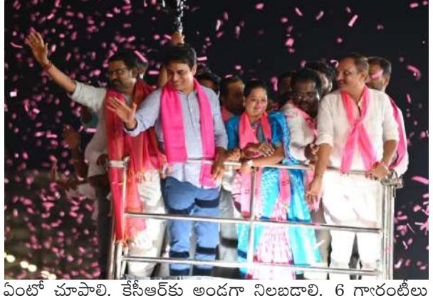
వింటో చూపాలి. కేటీఆర్ కు అందగా నిలబడాలి. 6 గ్యారంటీలు అమలు చేయడం చేతకాక తిట్లు, దేవుడిపై ఒట్లు, హిందువుల ఆస్తి ముస్లింలకు పంచుతారని బీజేపీ దుఃప్రచారం చేస్తోంది. రిజర్వేషన్లు రద్దు చేస్తారని కాంగ్రెస్ అబద్ధాలు ప్రచారం చేస్తోంది. ఒకరొకరు తిట్టుకుంటూ బీఆర్ఎస్ పార్టీని నిందిస్తున్నారు. కాంగ్రెస్ ఒట్లు అడిగేముందు ఆరు గ్యారంటీలు, ఎన్నికల హామీల గురించి మాట్లాడాలి. 2014 బడీ భాయ్ మోసం చేసింది.. 2023 బడీ భాయ్ మోసం చేసింది. జిల్లాల్లో ప్రజలు మోసపోయారు.. కాంగ్రెస్ పార్టీ వాళ్లు ఏదో చేస్తారనుకున్నారు. ఇప్పుడు హైదరాబాద్ లో పరిస్థితి ఏమైంది.. కొత్త పెట్టుబడులు తెచ్చే ముఖం లేదు.. ఉన్న కంపెనీలో తరలిపోతున్నాయి. మెడల పేగులు వేసుకుంటు.. జేబుల కత్తెర పెట్టుకుంటు అని అంటుంది.. ముఖ్యమంత్రి అట్ల మాట్లాడుతాడా? లంకె బిందెలు ఉన్నాయనుకున్నా అంటుంది? లంకె బిందెల కోసం పచ్చి దొంగలు కదా తిరుగేది? ఈరోజు నిర్మల్ లో రాహుల్ గాంధీ ఆరు గ్యారంటీలలో ఐదు గ్యారంటీలు అమలు చేసినవంటూ సిగ్గులేకుండా అబద్ధాలు చెప్పారు.మీ అమూల్యమైన ఓటు కారు గుర్తుకు వేసి భారీ మెజారిటీతో గెలిపించాలని కోరారు.మల్కాజ్జిరి పార్లమెంట్ బీఆర్ఎస్ ఎంపీ అభ్యర్థి రాగిడి లక్ష్మారెడ్డి మాట్లాడుతూ గత 25 సంవత్సరాలూ ప్రజా క్షేత్రం లో ఉన్నాను. ఎన్నో సేవా కార్యక్రమాలు చేశాను. కరోనా కష్టకాలంలో ప్రజలను ఆదుకున్నాను. ఇప్పుడు కేటీఆర్ ఆశీర్వాదించి నాకు మల్కాజ్జిరి పార్లమెంట్ ఎంపీ గా పోటీ చేసే అవకాశం ఇచ్చారు. దయచేసి ఒక్క అవకాశం ఇచ్చి, ఆశీర్వాదించండి.భారీ మెజారిటీతో గెలిపించండి. ఎందుకంటే మల్కాజ్జిరి పార్లమెంట్ ప్రజల మీద ప్రేమ లేని వారికి, పరిపాలన అంటే తెలియని వాళ్లకు, ఎక్కడో హుజూరాబాద్, తాండూరు లో ఉండే వాళ్లకు, కరోనా కష్ట కాలంలో ప్రజలను పట్టించుకోని బీజేపీ, కాంగ్రెస్ నాయకులను సమ్మెద్దు అన్నారు. ఉప్పల్ ఎమ్మెల్యే బందారి లక్ష్మారెడ్డి మాట్లాడుతూ తెలంగాణ రాష్ట్రం అద్భుతంగా అభివృద్ధి చేసినది కేటీఆర్, హైదరాబాదును విశ్వనగరంగా తీర్చిదిద్ది, ప్రపంచ పటంలో నిలిపినది కేటీఆర్, హైదరాబాదులో 10 ఏళ్ల ముప్పు ఆరు పైటపై కట్టినారు. ఎల్సీనగర్, ఉప్పల్ లో పై వేలు అందరి పాసులు నిర్మించారు. ఆరు గ్యారంటీలలో ఐదు గ్యారంటీలు అమలు చేసినవంటూ సిగ్గులేకుండా అబద్ధాలు చెప్పారు.మే 13 న జరిగే మల్కాజ్జిరి పార్లమెంట్ ఎన్నికల్లో ఈపీఎం ప్యాడీ లోని సీరియల్ నెం. 4 పై నొక్కి కారు గుర్తుకి ఓటిసీ గెలిపించాలని కోరారు. ఈ కార్యక్రమంలో ఉప్పల్ నియోజకవర్గం బీఆర్ఎస్ పార్టీ ప్రజా ప్రతినిధులు, ముఖ్య నాయకులు, కార్పొరేటర్లు, మాజీ కార్పొరేటర్లు, డివిజన్ అధ్యక్షులు, ఉపాధ్యక్షులు, ప్రధాన కార్యదర్శులు, బీఆర్ఎస్ పార్టీ సీనియర్ నాయకులు, కార్యకర్తలు మహిళలు, అభిమానులు, తదితరులు వేల సంఖ్యలో పాల్గొన్నారు.